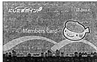
第1弾として、青梅市、あきる野市など8市町村の小売店やホームセンター